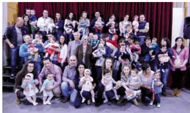
Día del Libro, 2015