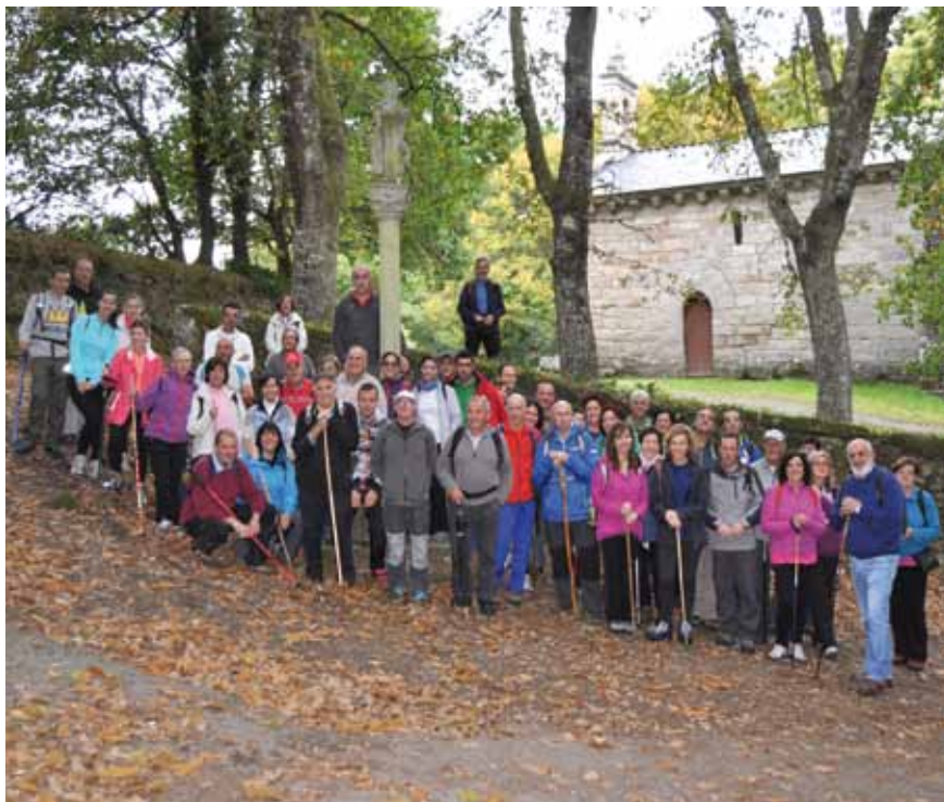
Ruta del Agua Guitiriz, 2015

Inscripciones: Hasta el 5 de Abril en el Área de Animación del Ayuntamiento de Coaña (985.473.535, extensión 3)