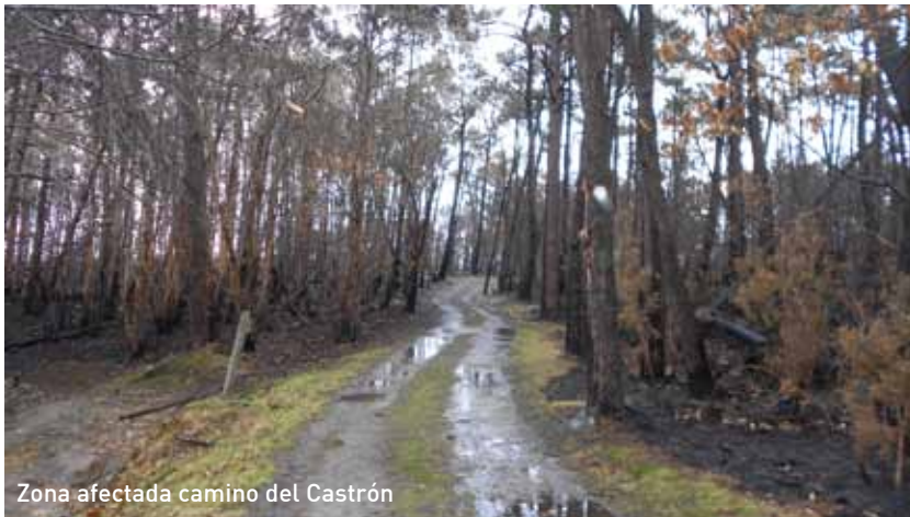
Zona afectada camino del Castrón

Desde el Equipo de Gobierno de esta Administración Local queremos dejar constancia de la labor altruista que realizaron diferentes vecinos pertenecientes a la localidad de Loza y alrededores para colaborar con el Ayuntamiento de Coaña en las labores de extinción del fuego que se produjo el pasado 19 de diciembre y se reavivó el lunes 28 del mismo mes.