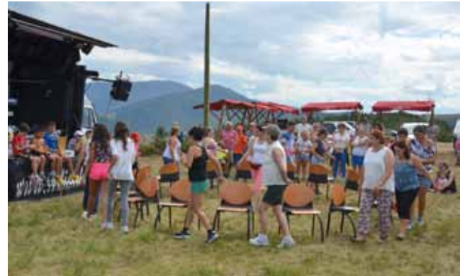
Romería Pico Jarrio, 2015