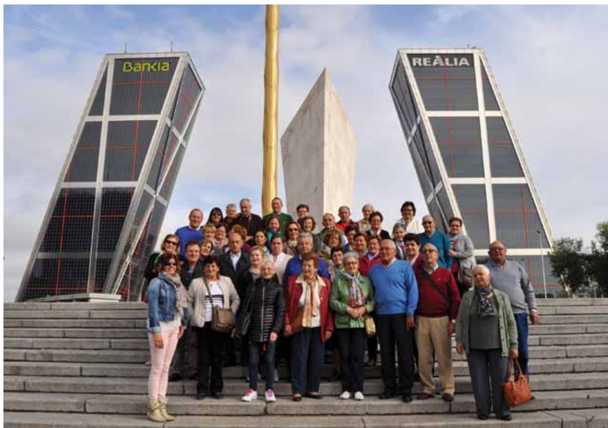
Viaje a Madrid 2015