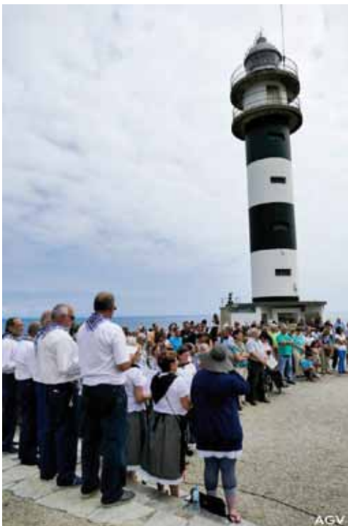
Día del Mar, 2015