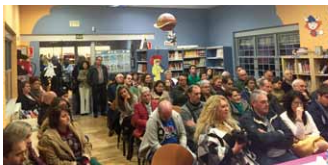
Cultura al Calor de un Café

Paralelamente al diseño del Plan se ha creado un grupo de participación infantil integrado por 12 escolares del colegio "Darío Freán" y próximamente se constituirá el Consejo de Infancia.