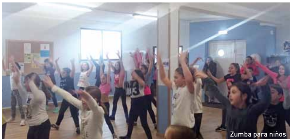
Zumba para niños

El 22 de octubre el Pleno de la Corporación en sesión ordinaria aprobó la modificación parcial de la ordenanza reguladora de las instalaciones deportivas municipales, modificando concretamente el artículo 5 "Cuotas tributarias".