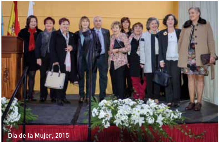
Día de la Mujer, 2015

Los actos tendrán lugar el sábado 12 de Marzo a las 12.30 horas en la Casa de Cultura Municipal (Ortiguera). El programa completo de esta celebración se publicará en fechas próximas.