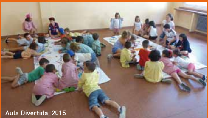
Aula Divertida, 2015