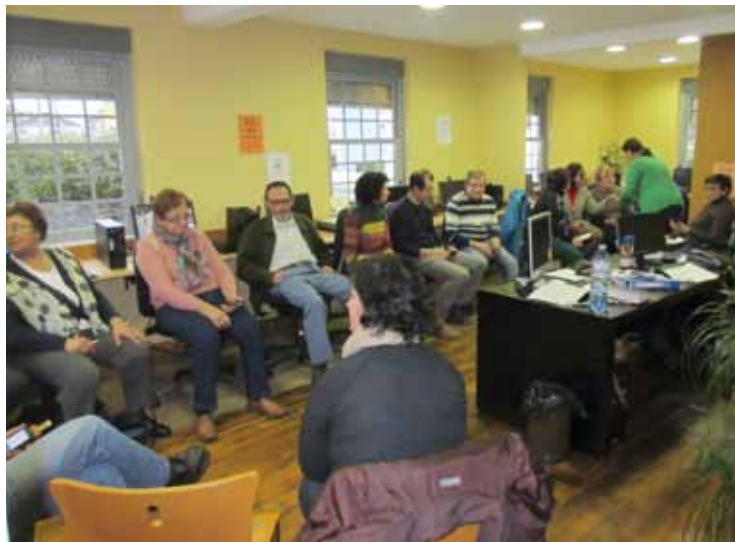
Actividad de uno de los talleres en el CDTL de Coaña