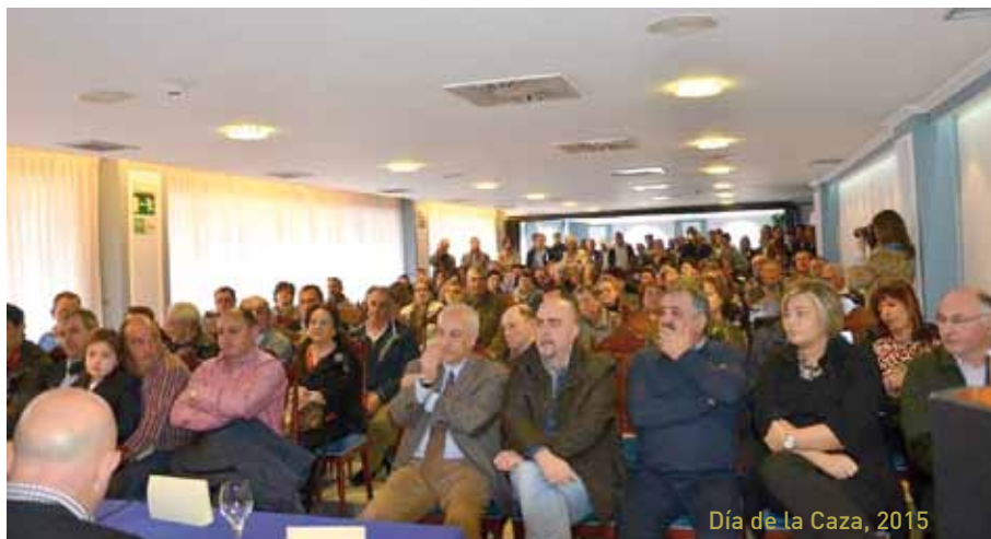
Día de la Caza, 2015

Los actos tendrán lugar en el Restaurante Blanco de La Colorada el sábado 5 de marzo. Las personas que deseen asistir podrán adquirir el correspondiente vale en el Ayuntamiento o a través de los miembros de la Junta Directiva de la Sociedad de Cazadores "El Corzo", hasta el viernes 26 de febrero.