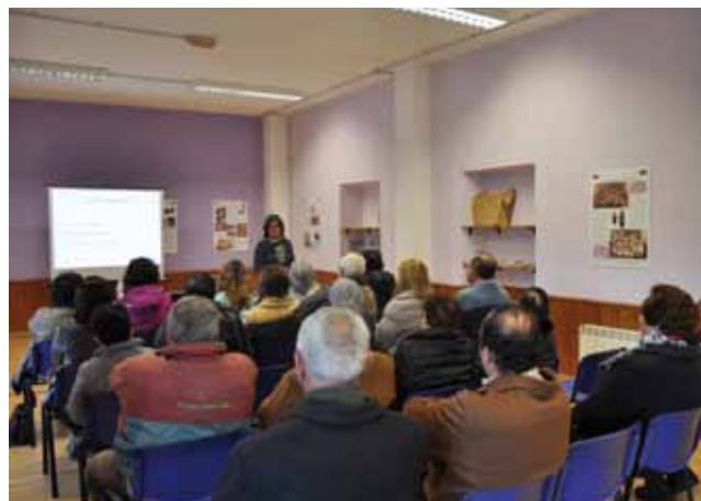
Charla sobre Osteoporosis y menopausia

Desde la Concejalía de Sanidad del Ayuntamiento de Coaña, debemos agradecer tanto a los profesionales que de forma totalmente desinteresada se prestan a colaborar, como a todas las personas que acuden a las charlas y con su asistencia garantizan la continuidad de este ambicioso proyecto.