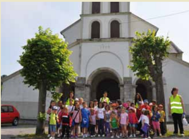
Aula Divertida 2013

Coincidiendo con las vacaciones escolares de los más pequeños en Navidad, la Concejalía de Infancia y Animación Sociocultural plantea una alternativa para el disfrute de esos días, en un ambiente distendido, lleno de juegos, creatividad y diversión.