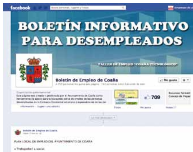
Página de Facebook del Boletín para Desempleados

Aunque en sus inicios se editaba de forma semanal, tanto en formato papel como digital, en la actualidad se edita exclusivamente de forma digital y diariamente a través de la página: www.facebook.com/boletinempleo.com , para que de este modo las ofertas publicadas sean lo más recientes posibles y lleguen rápidamente a sus destinatarios.