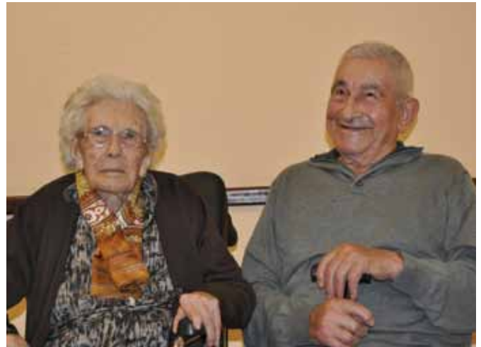
Homenajeados en el XI Día de Mayores, celebrado en 2012

Finalizada la COMIDA (previa presentación del vale), tendrá lugar una REPRESENTACIÓN TEATRAL a cargo del "Grupo Casadoiro de Anleo", que pondrá en escena la obra "Xuacu encontrou trabayu y algo más". Las personas interesadas en acudir, han de recoger su vale al precio de 10 euros en el Ayuntamiento de Coaña o la Biblioteca Municipal antes del 15 de Noviembre (reservándose la organización el derecho de cerrar el plazo antes de lo previsto debido a lo limitado del aforo)