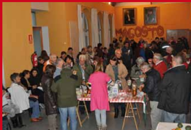
Fiesta del Magosto 2012

Y a partir de las cinco y media de la tarde, grandes y pequeños están invitados a degustar las tra-