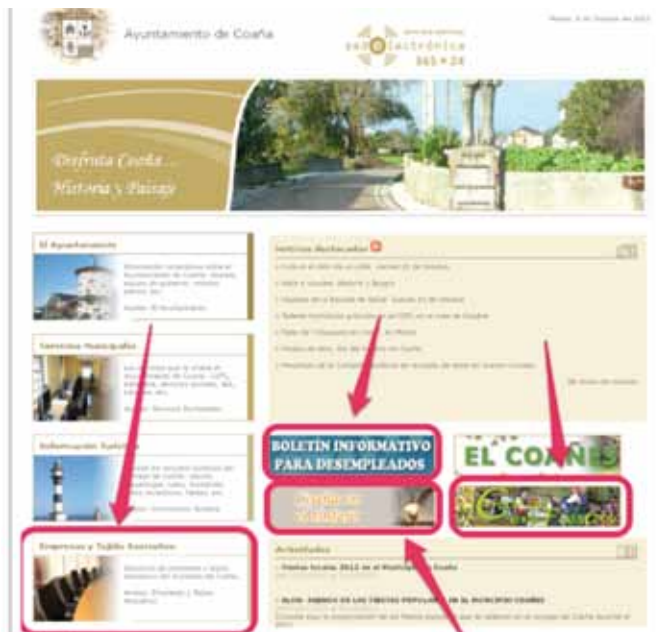
Web del Ayuntamiento de Coaña en la que aparecen señalados los accesos a los trabajos realizados por los alumnos del taller

En la web del Ayuntamiento de Coaña www.ayuntamientodecoana.com , están los botones con el acceso directo a estos trabajos.