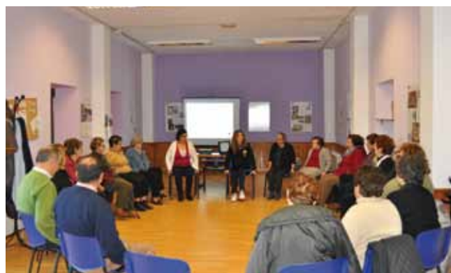
Charla "Evitando tropiezos"