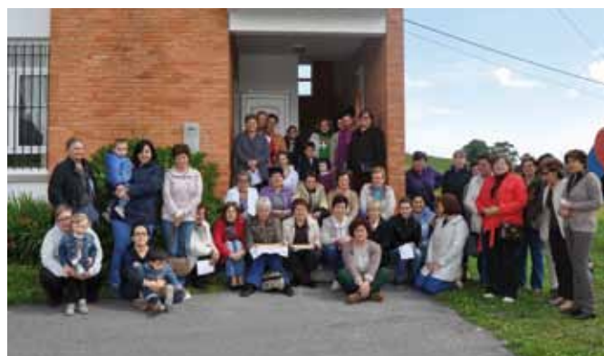
Coaña entre Fogones. San Esteban, 2012

"Coaña entre fogones" regresa en este último trimestre del año, con cuatro nuevas sesiones que se desarrollarán los días 25 y 27 de noviembre y 2 y 4 de diciembre en las Escuelas de Villacondide, de 10.30 a 12.30 horas.