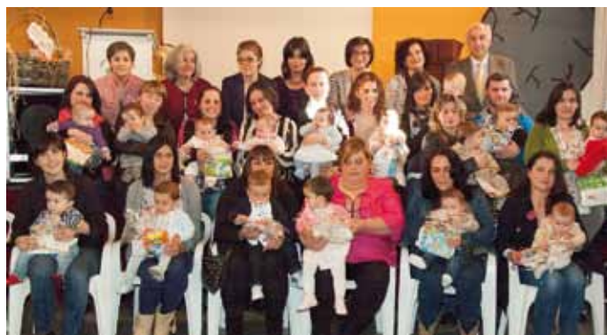
Plan de Animación a la Lectura

Desde 2012 Coaña lleva este trabajo a Pleno. El Plan es el mismo que se remite a la Campaña de Fomento de la Lectura del Ministerio de Cultura.