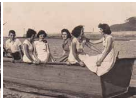
El libro hace un recorrido por la historia de este deporte de gran tradición en Coaña desde sus orígenes hasta la actualidad.