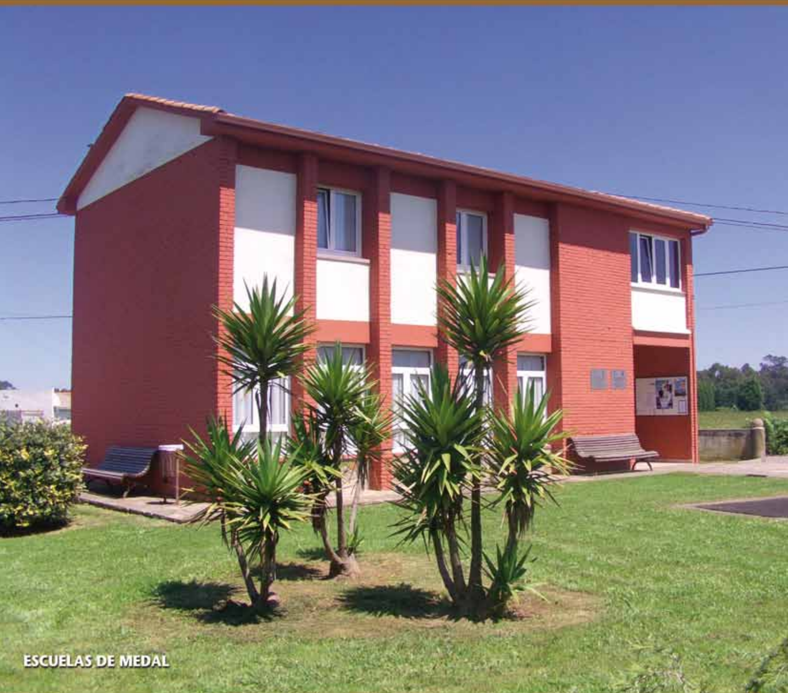
ESCUELAS DE MEDAL

REVISTA DE INFORMACIÓN MUNICIPAL • Nº 48 • OCTUBRE 2013