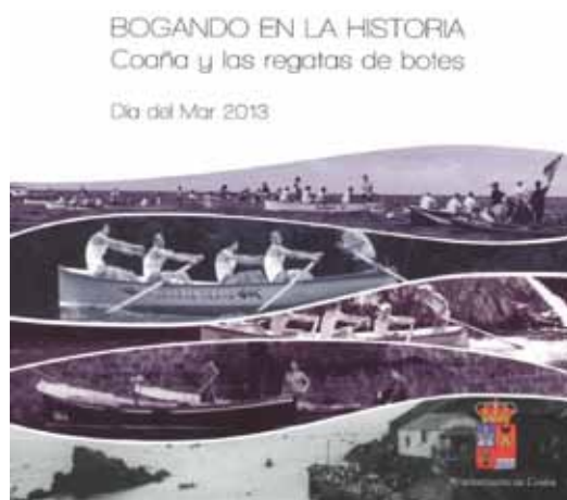
Portada del libro Bogando en la historia

El libro se puede adquirir en la Biblioteca Municipal o en la Oficina de Turismo. Su precio es de 10 euros.