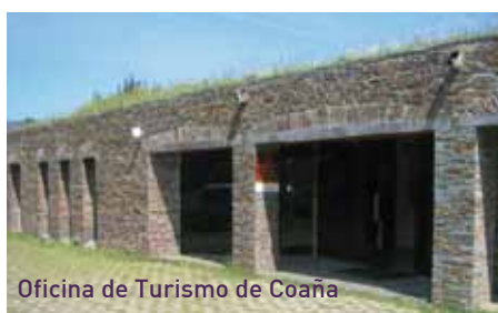
Oficina de Turismo de Coaña

La Oficina de Turismo de Coaña cierra su balance de este verano con un ligero incremento en el número de visitantes con respecto a las cifras del 2010. En total 2.085 personas han visitado la Oficina entre el 1 de julio y el 31 de agosto. De ellas, 876 lo hicieron en julio y 1.209 en agosto.