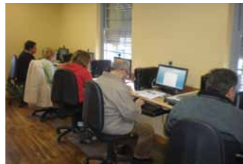
Taller de word 2007 para adultos celebrado en el CDTL durante el mes de marzo 2013 y taller para empresas Curación de contenidos, febrero 2013.

El Centro de Desarrollo Tecnológico de Coaña continúa con su programación de cursos para los próximos meses