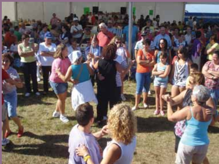
Romería Pico de Jarrío, 2012

En su décimo aniversario se organiza una ruta que, desde el Ayuntamiento de Coaña y a través de Meiro, llevará hasta la romería.