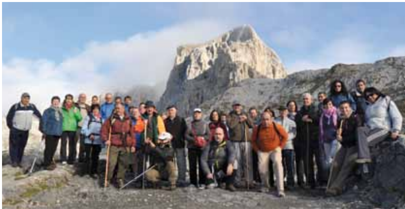
Ruta "Fuente Dé a Sotres", año 2012.