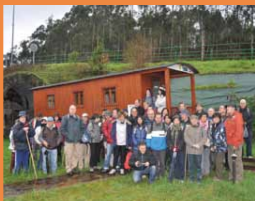
Ruta del Ferrocarril, febrero 2013

El viaje se realizará siempre y cuando se formalicen 45 inscripciones.