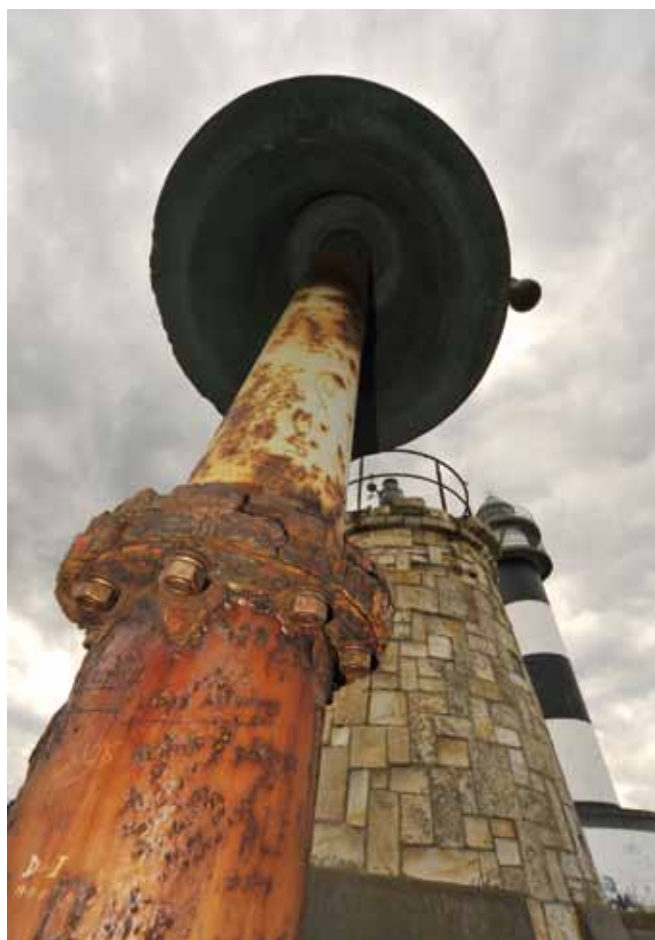
Fotografía primer premio maratón fotográfico por Coaña (2012).

La convocatoria, fechas de inscripción y bases del mismo se publicarán en la web municipal.