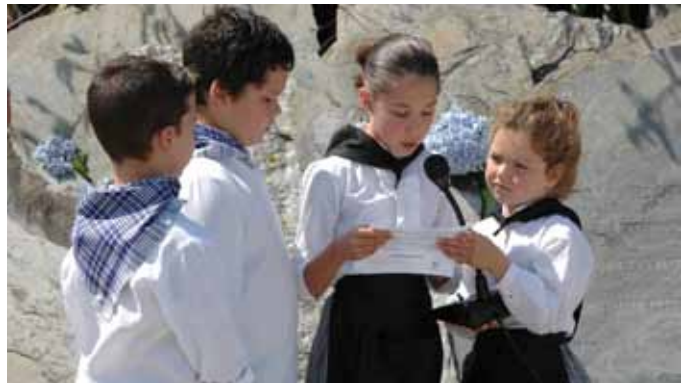
Ofrenda Día del Mar 2012

Recibe el apoyo de las asociaciones cultural y de Vecinos de Ortiguera, además toda la parroquia que se vuelca con la celebración de este programa, que incluye: