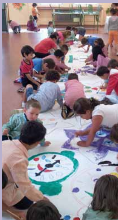
Aula Divertida 2012

La participación en estas jornadas está abierta a todos, pero es necesario inscribirse antes del 11 de Abril. La actividad es gratuita.