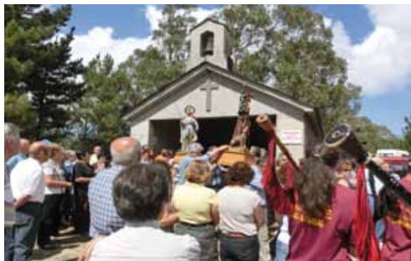
Romería San Luis - La Ronda