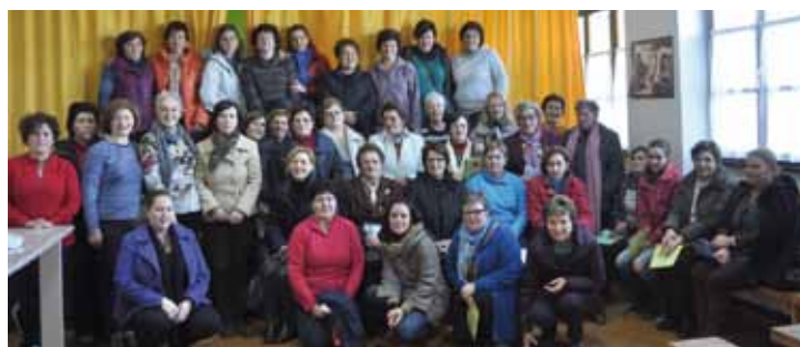
Coaña entre fogones 2012. Villacondide

Un año más, todos los niños y jóvenes que deseen aprender coreografías, batuka, aeróbic y, en general, disfrutar del baile, tienen una cita con “AL SON DEL VERANO”, que se desarrollará en el Colegio Público “Darío Freán” de Jarrio en horario de 10.30 a 12.00 horas, siendo el coste mensual de la actividad de 15 euros. INSCRIPCIONES: hasta el 21 de Junio.