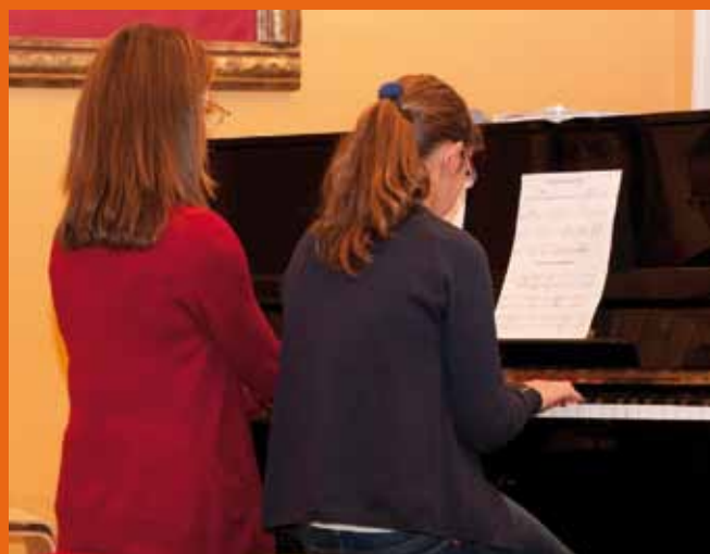
Actuación Festival de Navidad 2012

El precedente está en el "Boletín de desempleados" que el Ayuntamiento puso en marcha en 2012, que se podía descargar desde la web municipal y se actualizaba semanalmente. En Enero de 2013 para facilitar el acceso al Boletín el Taller de empleo "Coaña Tecnológico", puso en marcha esta página a la que se puede acceder desde la web municipal o bien en la siguiente dirección: http://www.facebook.com/boletinempleocoana .