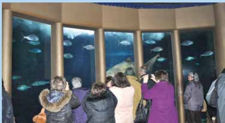
Viaje a Coruña, marzo 2013

DÍA 4 DE MAYO. – Visita a Lisboa y panorámica de la Praça do Comercio, Torre de Belem, Monumento de los Descubrimientos y Monasterio de los Jerónimos. Comida y tarde libre por Lisboa.