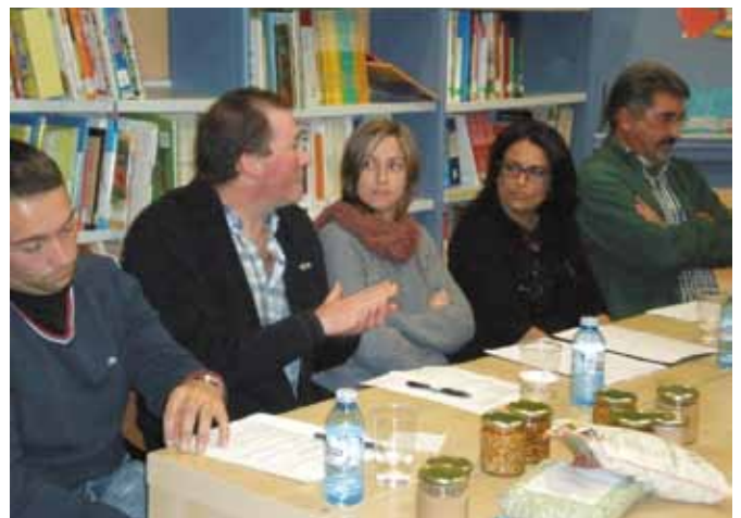
Cultura al calor de un café

La Biblioteca también desarrollará una actividad de extensión cultural dirigida a padres y madres, "Cuento contigo" que busca concienciar sobre el papel que tiene la familia en la consolidación del hábito lector y la importancia del cuento como herramienta educativa. La actividad se desarrollará en el colegio público Darío Freán, el martes 23 de Abril de 15:00 a 16:30 h.