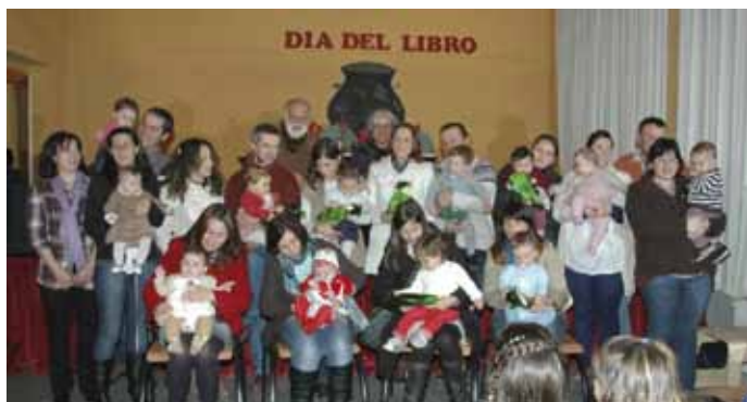
Día del libro 2012

Viernes 26 de Octubre: "Cuerda para rato". Pasado de la Rondalla de Villacondide y presente de la Rondalla Nostalgia. (homenaje, tertulia y concierto).