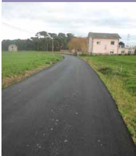
Camino en Loza