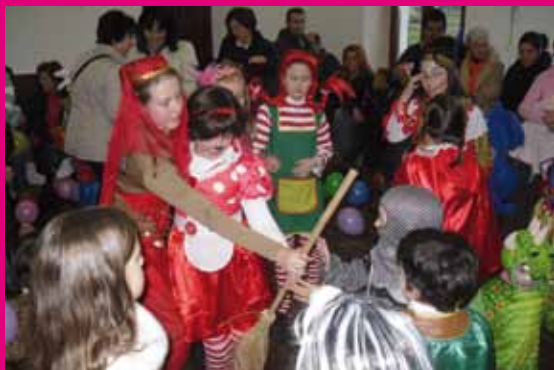
Fiesta de Carnaval 2012

15 y 16 de Febrero en la Casa de Cultura en Ortiguera. 18:00 h.