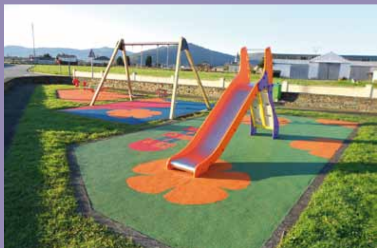
Parque de Ortiguera