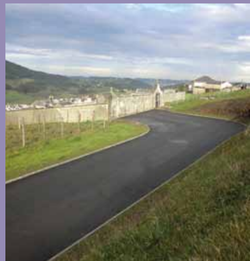
Aparcamiento cementerio de Coaña

El Ayuntamiento de Coaña, a través de la ayuda concedida por la Consejería de Hacienda y Sector Público, Dirección General de Administración Local, denominada "Fondo de Cooperación Municipal" está ejecutando las siguientes obras: