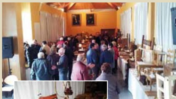
La gala de 2012 contó con numerosos visitantes y expositores

Todas aquellas personas que deseen exponer sus obras en esta gala, pueden contactar con la Oficina de Turismo Municipal a través del teléfono 679.810.007 o el siguiente correo electrónico: areadeturismo@ayuntamientodecoana.com].