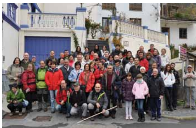
Ruta a la Cascada de la Seimeira

Las personas interesadas en participar, deben inscribirse en el Área de Animación Sociocultural antes del 15 de Febrero, siendo el coste del viaje de 25 euros, incluyendo transporte y comida.