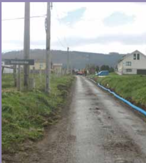
Acceso a Silvarronda