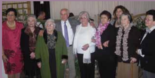
Las mujeres homenajeadas en 2012 con el Alcalde y la Concejala de la Mujer

La conmemoración del Día Internacional de la Mujer se convertirá en uno de los actos centrales de la vida municipal coañesa durante el primer trimestre del año, y se celebrará en el Polideportivo del Colegio "Darío Freán Barreira" de Jarrío, a partir de las cinco y media de la tarde para dar paso después a una es-picha con baile.