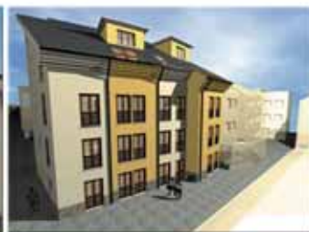
Puerto de Vega