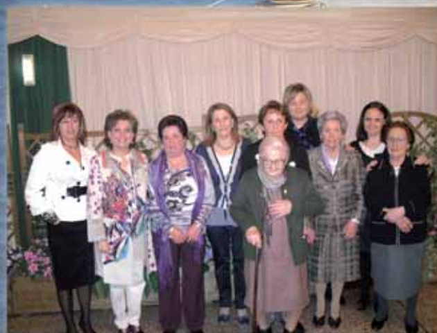
DÍA DE LA MUJER 2010

LEY DE DEPENDENCIA, CÓMO TRAMITAR LAS AYUDAS