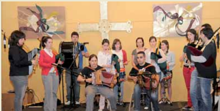
Actuación Musical año 2009.

Se celebrará el sábado 19 de junio en la Casa de Cultura Municipal, a partir de las 19:00 h. En este acto se podrá disfrutar de la actuación de los alumnos de la Escuela de Música en las diferentes modalidades que se imparten.