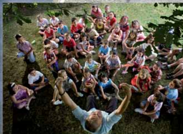
AULA DIVERTIDA 2009