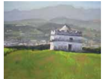
Ganador del II Concurso de Pintura.

La Concejalía de Cultura del Ayuntamiento de Coaña convoca el III Concurso de Pintura al Aire Libre que se celebrará el sábado 17 de julio.