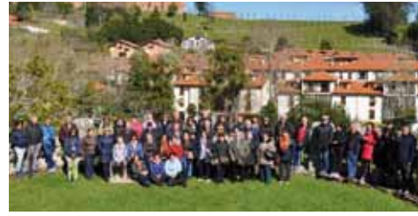
Fin de Semana Lebaniego 2019

De la mano de la concejalía de Bienestar Social del Ayuntamiento de Coaña, llevaremos a cabo entre