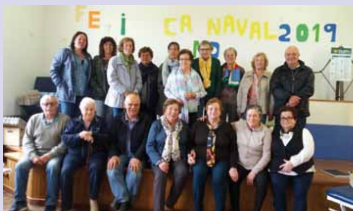
Asistentes Taller de Memoria de Jarrío

Las personas interesadas en participar, deben inscribirse antes del 3 de octubre en el Área de Animación del Ayuntamiento de Coaña, siendo el mismo totalmente gratuito y estando destinado a