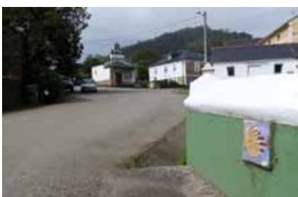
Camino de Santiago en Folgueras

Nuestro Concejo, forma parte del trazado del Camino de Santiago, lo que supone contar con un importante recurso turístico y económico para nuestro desarrollo. Conscientes de ello,