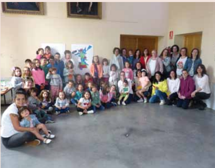
Asistentes al Taller – junio 2019

Coaña apuesta por la igualdad uniendo fuerzas, por lo que el Centro Asesor de la Mujer, Área de Animación Sociocultural, Biblioteca Municipal y Plan de Infancia, se han dado la mano para avanzar en materia de igualdad y para rechazar y prevenir la violencia de género.