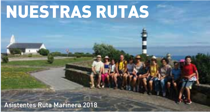
Asistentes Ruta Marinera 2018

Un año más, la Concejalía de Turismo plantea la realización en período estival de dos rutas guiadas y gratuitas destinadas a dar a conocer la belleza cultural y paisajística de nuestro municipio a vecinos, visitantes y turistas que deseen acudir, sin necesidad de inscribirse previamente.