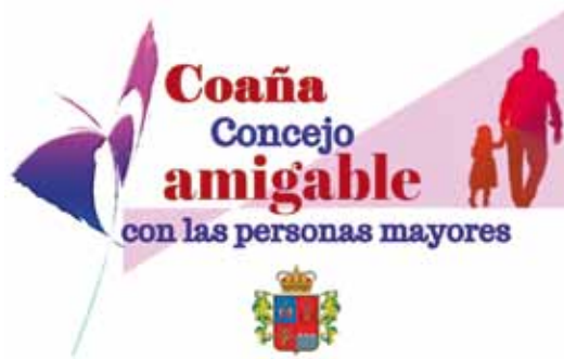
Logotipo del proyecto

La adhesión a la Red implica analizar cómo es nuestro concejo, como mejorarlo y hacer los cambios necesari-