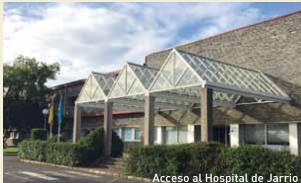
Acceso al Hospital de Jarrío

Sin embargo, desde hace unos años estamos asistiendo a constantes recortes, falta de profesionales de mu-