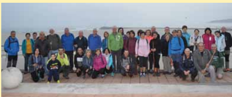
Ruta Foz a Burela 2018

Conmemoraremos este año el Día del Deporte, con la organización de esta ruta de senderismo para toda la familia que nos llevará a recorrer los Lagos de Covadonga. Se trata de una senda circular, de apenas 6 kilómetros que recorre la Mina de la Buferrera, el Lago Ercina, la Laguna Bricial, el Lago Enol y el Mirador de la Princesa, inaugurado hace pocos meses. La salida será el domingo 31 de Marzo, a las 8 de la mañana de la marquesina del Hospital de Jarrío, debiendo las personas interesadas en acudir, formalizar su inscripción antes del 26 de Marzo en el Área de Animación del Ayuntamiento de Coaña. El coste del viaje es de 15 euros para los adultos y gratuito para todos los niños y niñas que acudan, siendo necesario llevar comida.