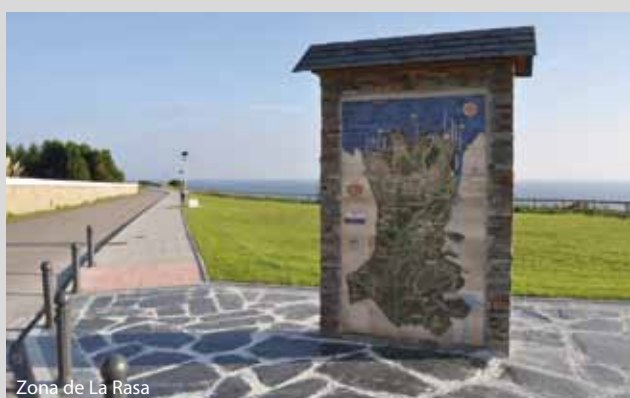
Zona de La Rasa

Se ha procedido a la renovación del parque infantil ubicado en el entorno de las Escuelas de Medal. Dicha renovación y arreglo, ha supuesto a las arcas municipales un desembolso.