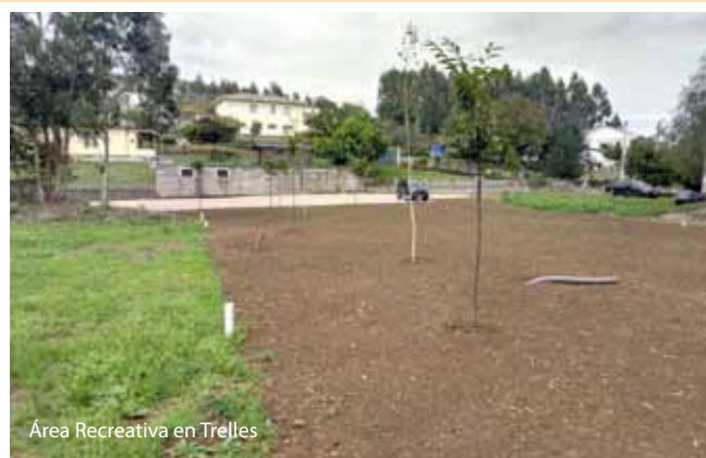
Área Recreativa en Trelles

Acondicionamiento de camino de acceso a nueva vivienda en Porto.