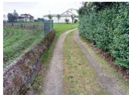
El Camino de Santiago en Cartavio