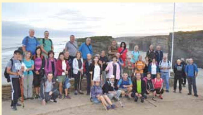
Ruta Las Catedrales - Foz

Domingo 17 de Diciembre , procederemos a la colocación de nuestro tradicional "BELÉN DE CUMBRES" EN EL PICO JARRIO. La salida será a las 9.00 horas del Albergue Municipal y al regreso, los participantes serán invitados a un bollo preñado y un chocolate caliente de forma gratuita. Para participar es necesario inscribirse antes del 13 de diciembre en el Área de Animación.