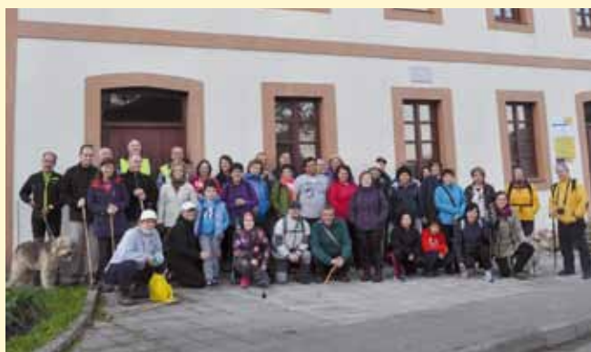
Belén de Cumbres 2016