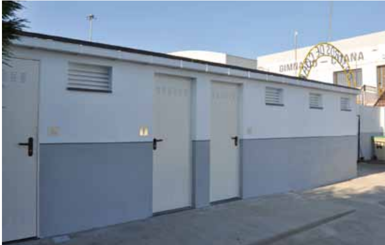
Baños en la Unión Deportiva Los Castros

SE HAN EJECUTADO DURANTE LOS MESES DE VERANO