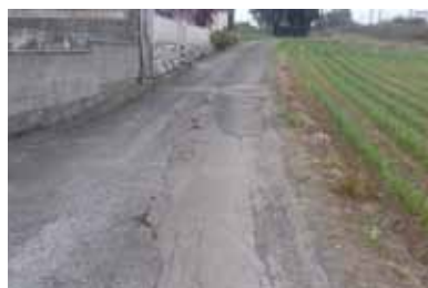
Camino de Santiago a su paso por Barqueiros

En la actualidad, se está a la espera de los permisos necesarios por parte de las direcciones generales de Cultura y Carreteras para proceder a iniciar la fase de licitación.