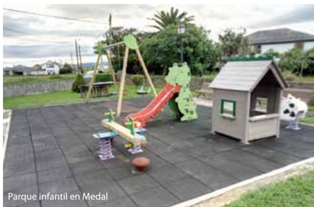
Parque infantil en Medal