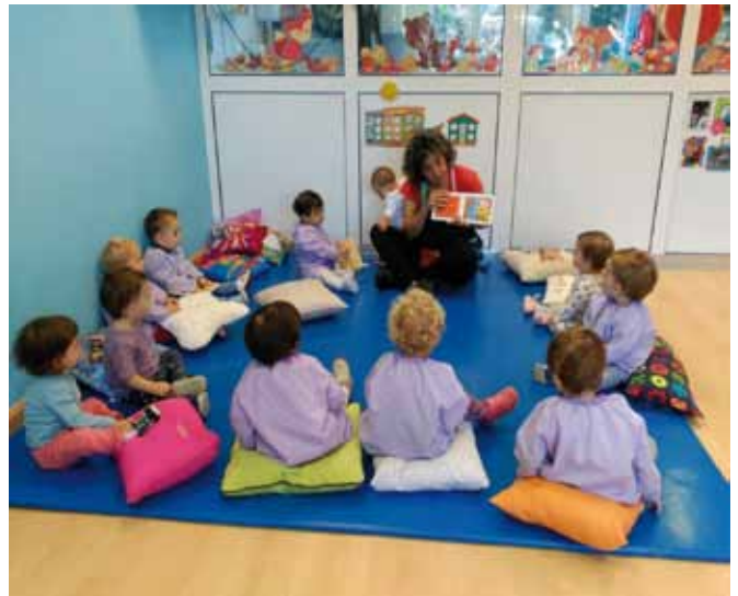
Asamblea en la Escuela “La Estela”

Para el funcionamiento de este centro a lo largo del año 2016, la Consejería de Educación y Cultura, ha aportado 99.380,01 euros para un coste de funcionamiento de 210.780,20 euros, de los cuales 65.771,86 euros son aportados por las familias a través de sus cuotas mensuales y los 45.628,33 euros restantes son financiados por las arcas municipales.