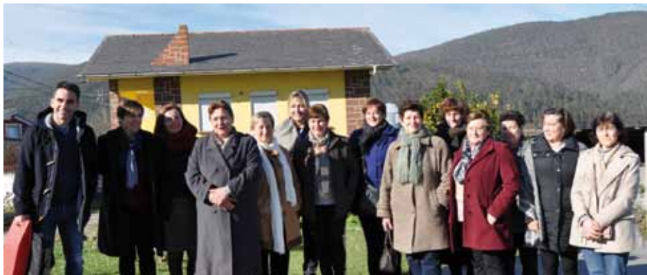
Participantes en I Encuentro de Ganaderas celebrado en enero de este año

Tras el homenaje celebrado a las mujeres ganaderas del municipio en marzo de 2016 con motivo del "Día de la Mujer" y teniendo en cuenta las peticiones que en ese contexto se formularon, en el mes de enero se organizó el "I Encuentro de Ganaderas del Municipio de Coaña", que pese a no haber congregado a gran número de asistentes, sí consiguió convertirse en una jornada de encuentro e intercambio de experiencias y