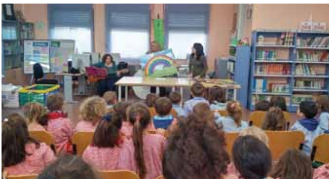
Cuento musical en la Biblioteca

- Día de la Biblioteca: El 24 de Octubre conmemoraremos el Día de la Biblioteca en la Escuela Infantil La Estela iniciando las programaciones de Un puente literario para el curso escolar 2017/2018.