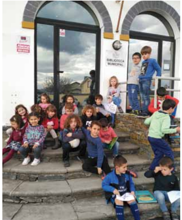
Los más pequeños también son usuarios de la Biblioteca

Participar en esta campaña supone mucho más que un reconocimiento a una gestión bibliotecaria íntimamente vinculada a las peculiaridades y necesidades del concejo; es una manera de actualizar y nutrir el fondo bibliográfico, principalmente de novedades en literatura infantil y juvenil. Coaña participa en esta iniciativa para acceder a un premio de 1.606,6 euros para la adquisición de libros.