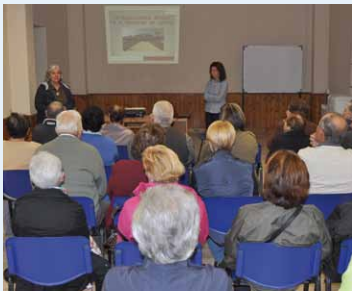
Charla de la Escuela de Salud en 2017