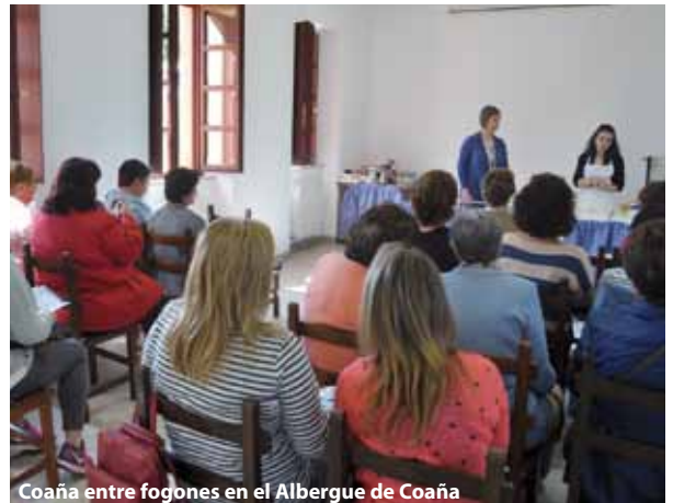
Coaña entre fogones en el Albergue de Coaña