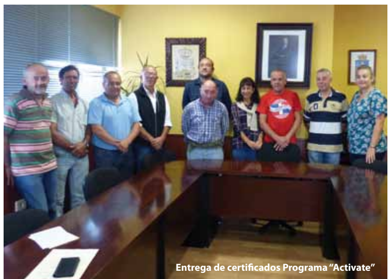
Entrega de certificados Programa "Actívate"

Junto a estos ocho participantes, un mentor y un monitor fueron las personas encargadas de dirigir el programa que además sirvió para realizar diferentes obras como la limpieza del Camino de Santiago y las Áreas Recreativas y la creación de una nueva Área en Trelles.