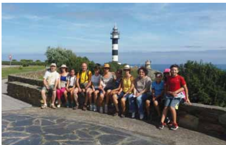
Participantes en la Ruta Marinera 2017

Como actividades complementarias, un año más se ha realizado la Ruta marinera, donde se dan a conocer los secretos de la localidad de Ortiguera, y la Ruta Etnográfica, que nos acerca a la historia del Concejo, desarrollándose la primera el 26 de julio y el 23 de agosto, y la segunda el 19 de julio y