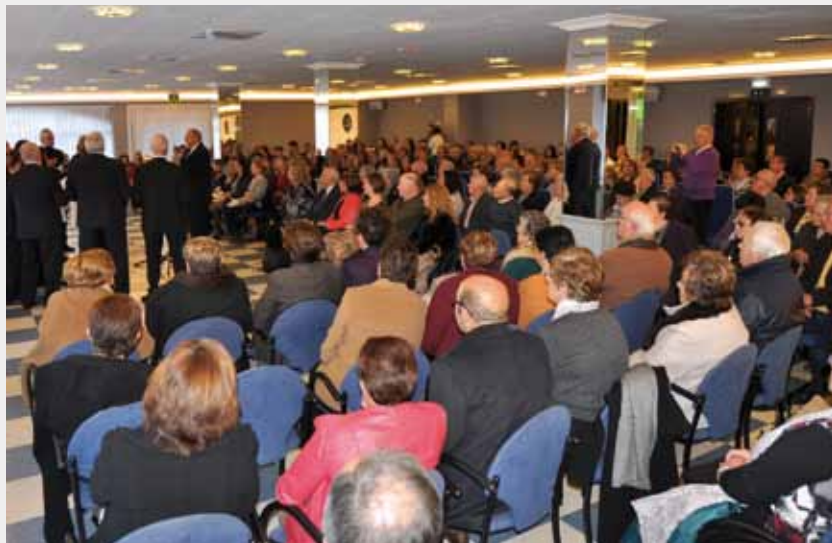
Celebración del Día de Mayores en 2016

La comida tiene un coste de 15 euros y los vales estarán disponibles hasta el 17 de Noviembre en el Ayto. de Coaña y en la Biblioteca Municipal.