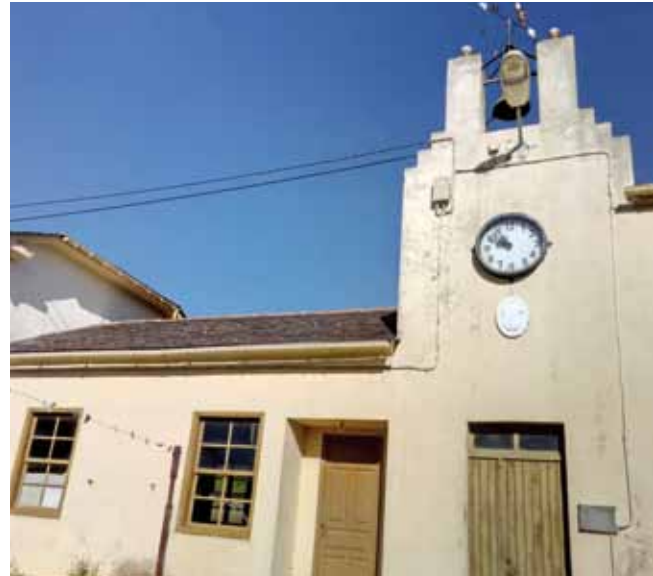
Escuelas de Trelles