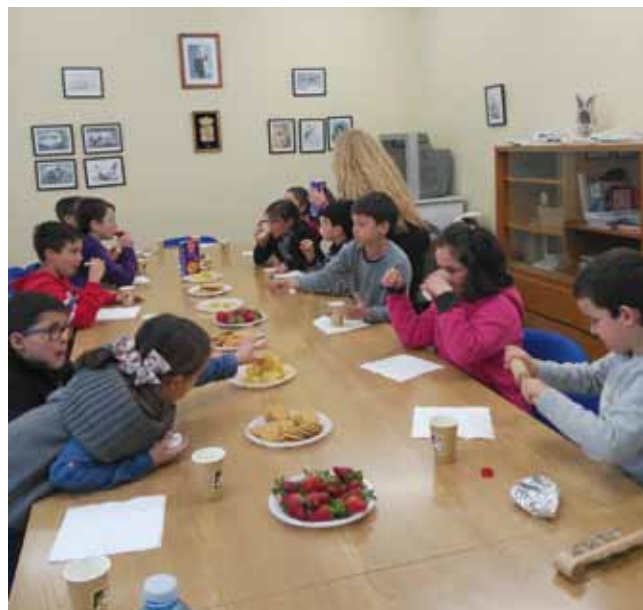
Desayuno de trabajo

DICIEMBRE: "¡Bienvenida Navidad!" Miércoles 13 y 20.