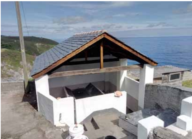
Lavadero de La Cabana

En la actualidad, se está procediendo a la reparación de las Escuelas de Trelles, donde están previstas actuaciones tanto en el exterior (tejados, carpintería, fachadas, iluminación y pavimentación) como en las estancias interiores.